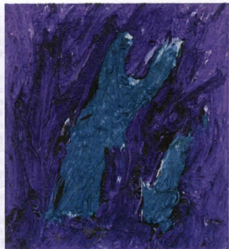
2014: Après Jean Genet V, South Africa III, Limone sul Garda (vlnr).