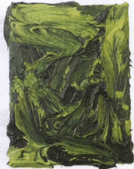
2004: Zonder titel 30, Zonder titel 37 en Zonder titel 42 (vlnr).