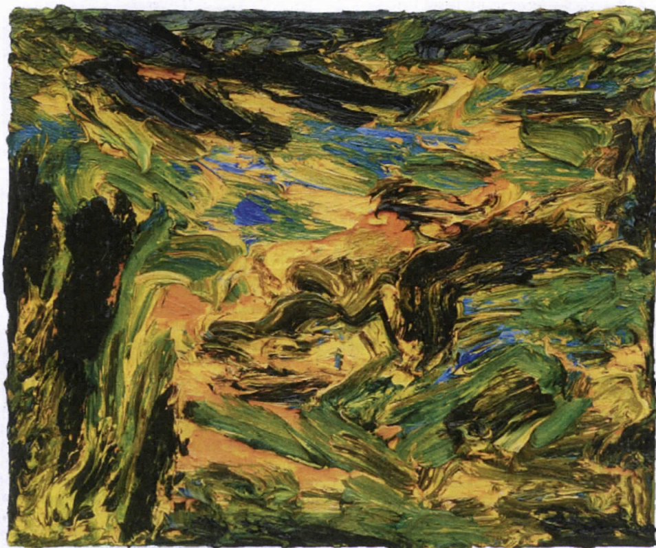
2024: Naar Brückner, zeven.

www.jandebeus.nl www.museumflehite.nl , tot 2 maart